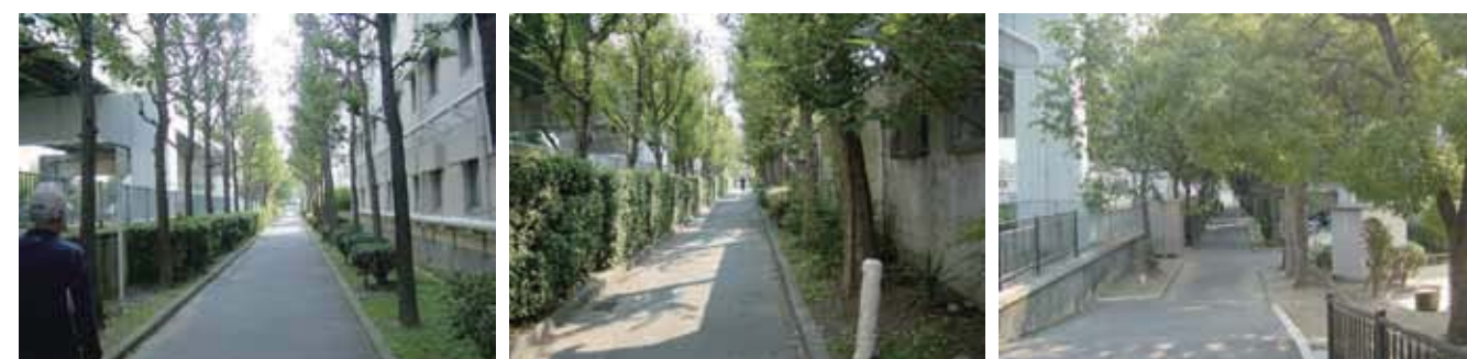
写真■緑のトンネル-樹木が生い茂る遊歩道-左岸 (左から順に香蘭橋・西大宮橋・新森小橋付近で撮影)