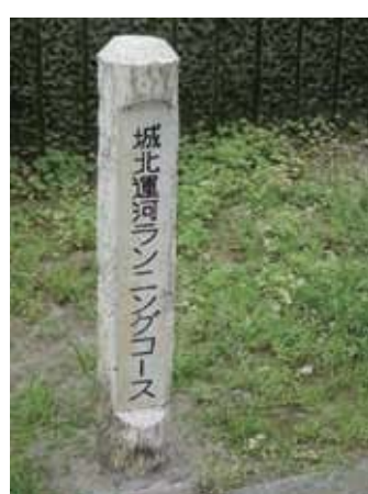
写真■ランニング・コース標識 (1,000メートル~2,000メートルまで全6コース)

30才代の「健康マラソン」(昭和57年(1982)当時)「東雲に空染まる頃、トレーニングウェアに身を包み、近くの城北運河沿いのランニングコースをジョギング。