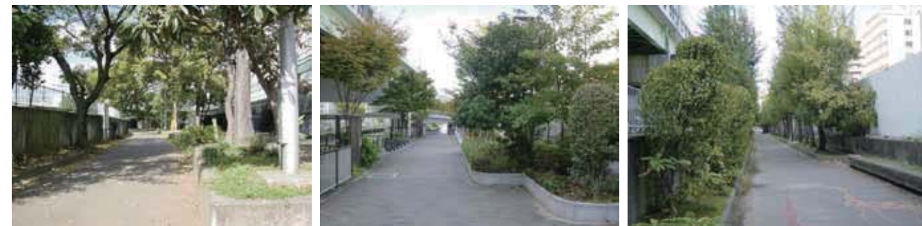
写真■緑のトンネル-樹木が生い茂る遊歩道-右岸 (左から順に菫橋・東大宮橋・旭区民センター付近で撮影)