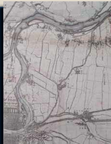
地図■明治20年(1887)の旭区周辺

例えば、明治20年(1887)の地図を見ると、暮らしの場が数か所に点在していることなどが分かります。