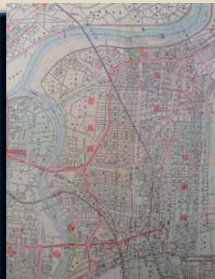
地図■昭和29年(1954)の旭区周辺